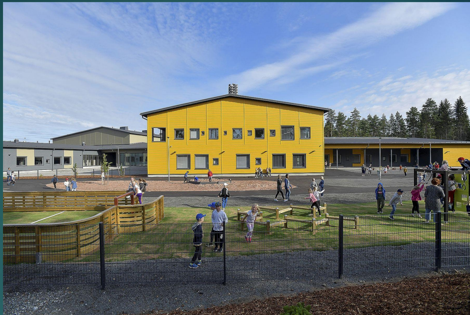
POHJOISKEHÄN KOULU RAUMA